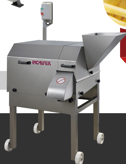
MST - 125