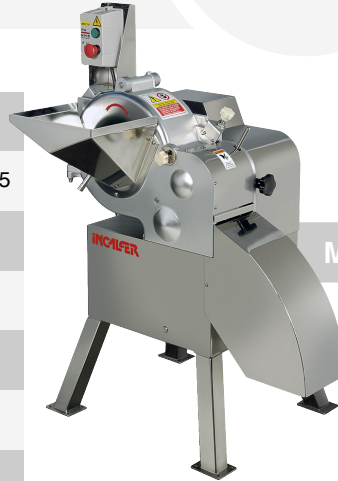
MST - 90